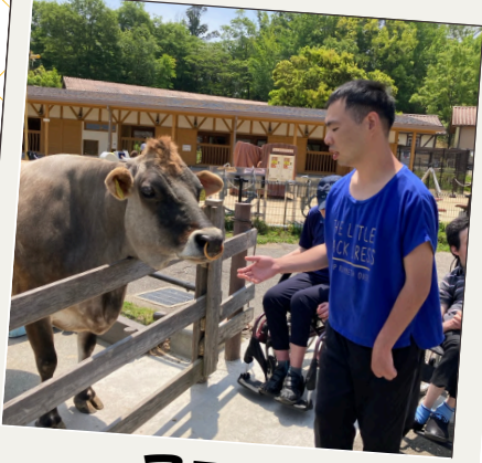
アニマル フレンドパーク