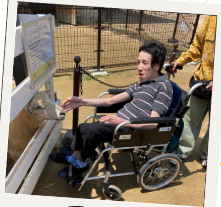
アニマル フレンドパーク