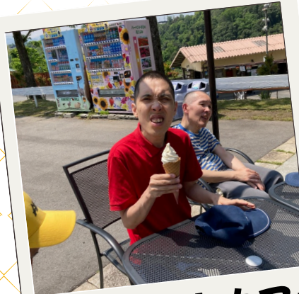
ハーベストカフェ