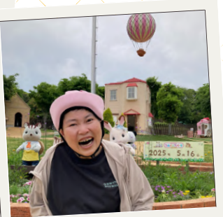
シルバニアパーク