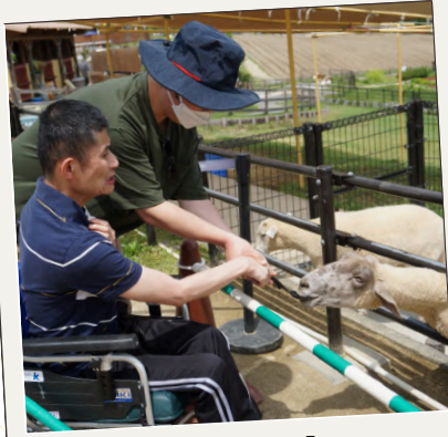
アニマル フレンドパーク