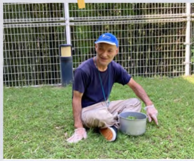
暑い日も寒い日も、中庭や駐車場の落ち葉拾いや除草をありがとう。