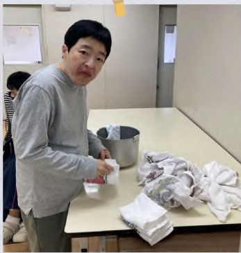
毎日みんなの顔拭きタオルをたたんでくれてありがとう。