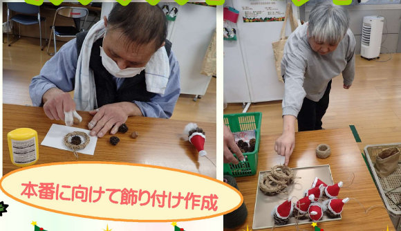
本番に向けて飾り付け作成

拾ってきた木の実や、昼休みにやった手のスタンプアートの紙を使ってクリスマスの飾りを作りました。ツリーの飾りつけ、壁や窓にステッカーを貼ったりと気分も盛り上がったところでクリスマス会！