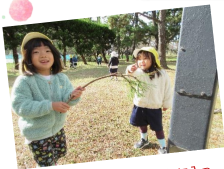
松の木の枝をゲット！気に入ってずっと手に持っていました。