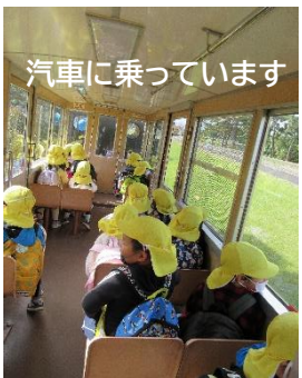
汽車に乗っています