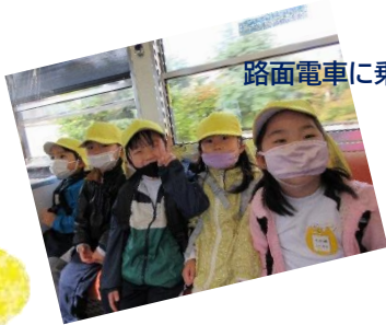
路面電車に乗って浜寺公園へ