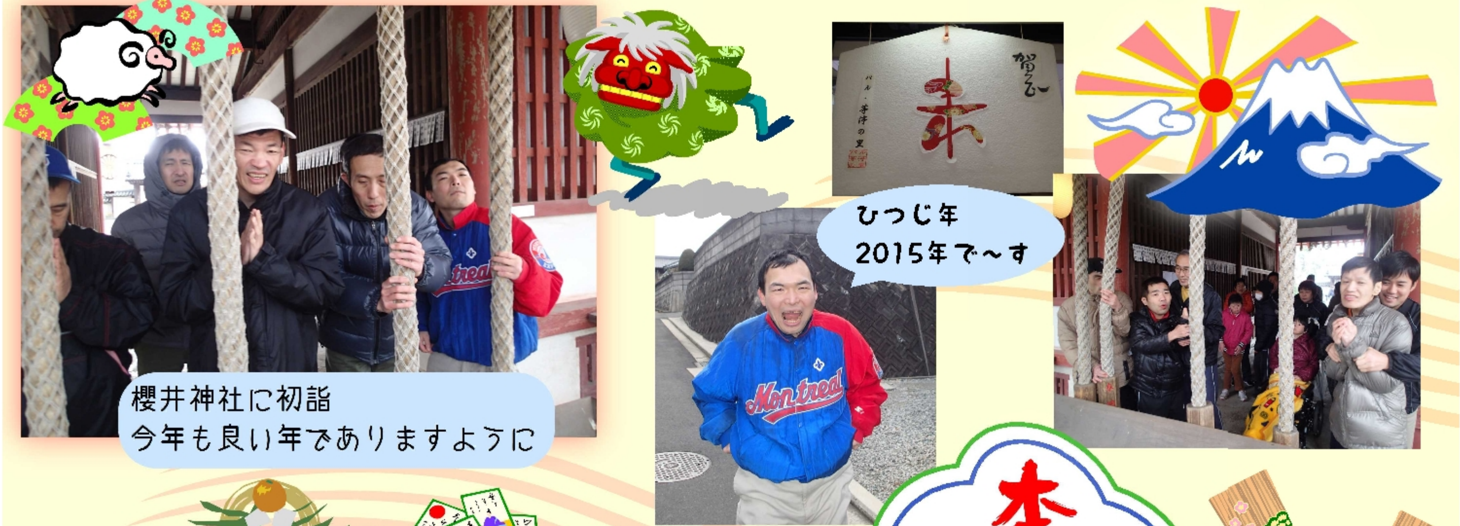
櫻井神社に初詣 今年も良い年でありますように