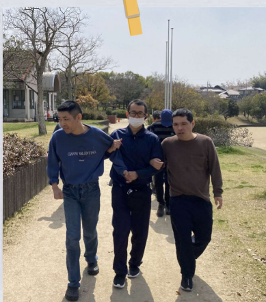
光明池緑地運動施設