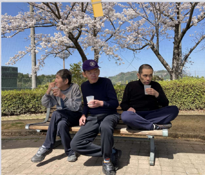
富田林スポーツ公園

まずは活動の様子です。「健康促進、体力・身体機能維持」を目的としたウォーキングやドライブを主に行っています。一日では全員参加して頂く事は難しいため、一週間で全員が参加して頂けるようグループ分けを行い実施しています。ドライブでは近隣の公園に移動し20分程のウォーキングを行います。ウォーキングでは大蓮公園、フォレストガーデン、櫻井神社を目的地として行います。